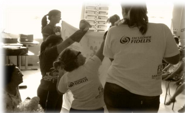
Agudos do Sul/2013

O fortalecimento do Projeto: PROCLAMAI para atender uma acentuada demanda, ocorreu por meio dos diversos investimentos, o que sinalizou diferentes ações na gestão institucional. O Projeto: PROCLAMAI traz em sua estrutura o eixo humanista, nas ações de educação, arte, cultura, música, assistência social, aconselhamento, Capelania, esporte e ainda a preservação da história da FEM – Fundação Educacional Menonita no Bairro do Boqueirão e bairros do entorno.