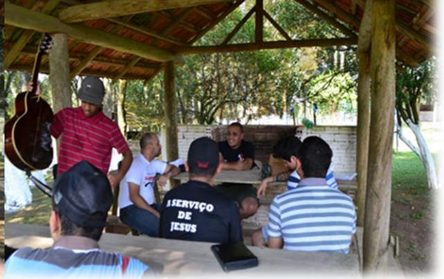
São José dos Pinhais – Vila Cachoeira/2012