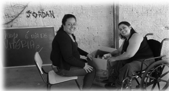
ONG “Voice For Change” (Vila Audi, Curitiba-PR)